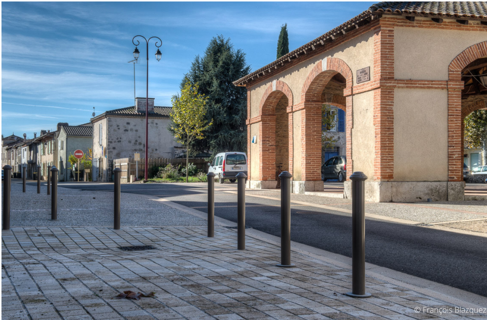
Remplacement et uniformisation du mobilier urbain.