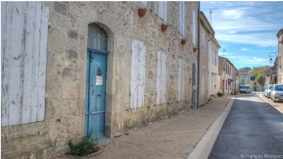
Gestion des eaux de pluie