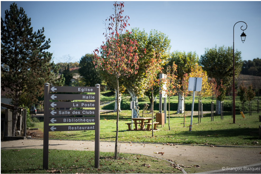
Plantation d'arbres pour créer des espaces ombragés et rythmer le paysage.