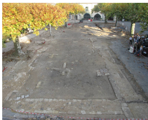
En cours de chantier : découverte de l'église.

Un marquage au sol (bandes en pierre) reprend le tracé des fondations de l'église, fondée vers la fin du XI e siècle, rendant ainsi perceptible l'histoire de la commune.