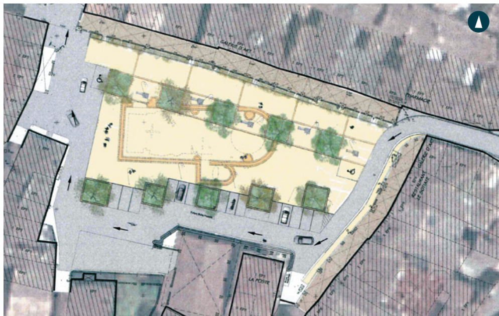
Plan de la place Armand Fallières, emplacement des fondations de l'église primitive de Saint-Sernin.

Subvention départementale programme d'aides « Bastides, villages de caractère et plus beaux villages de France », mise en valeur du tracé de l'église en pierre