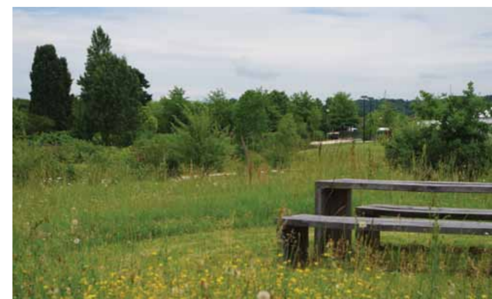
Bancs, tables de pique-nique et ombrières invitent à la détente et aux échanges.

Vous avez réalisé sur votre commune un projet architectural (extension, rénovation, construction d'un bâtiment) ou un aménagement d'espaces publics.