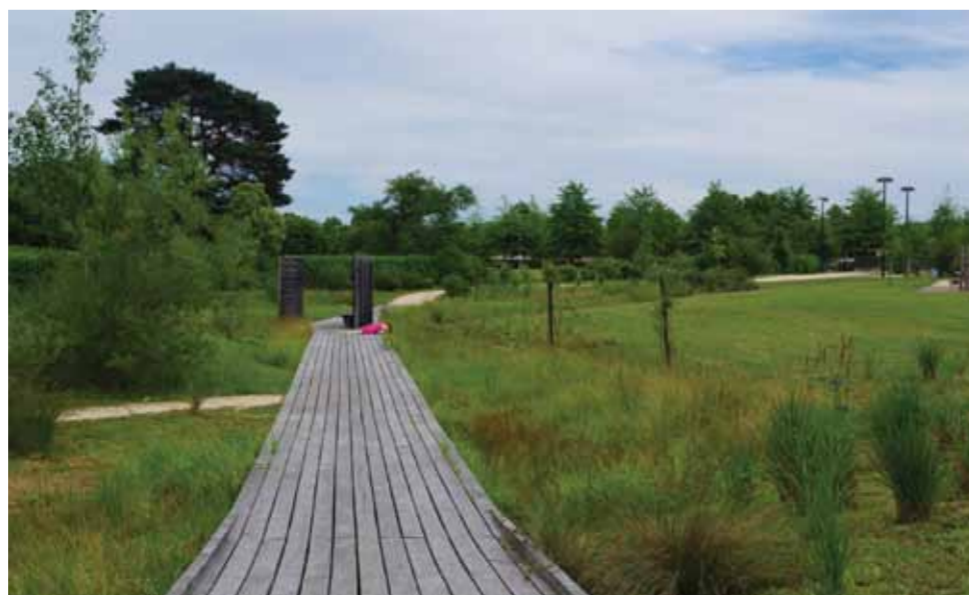
Grandes herbes et plantes hygrophiles autour de la passerelle et de l'observatoire.

Jean-Michel Sagols, paysagiste-concepteur