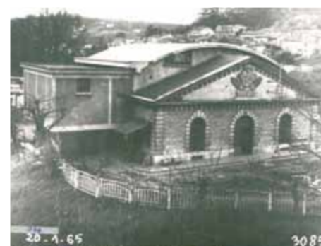
Vue de l'usine en 1965. Les modifications successives (démolition d'une partie de la toiture en ardoises remplacée par une voûte en béton, création d'une extension accueillant un poste de transformation électriques sur la façade ouest) ont dénaturé la composition symétrique du bâtiment.