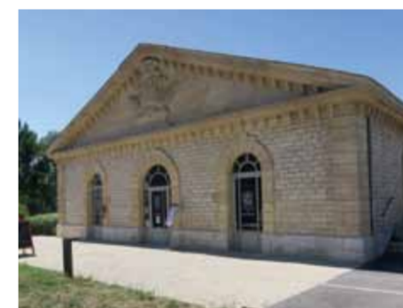
Entrée haute, depuis l'esplanade, à proximité du pont-canal. Représentatives des compositions de l'architecture néo-classique, les façades sud et nord sont caractérisées par des frontons triangulaires, aux cadres moulurés. Le fronton triangulaire de la façade sud est orné de l'inscription château d'eau, de feuilles de palmiers et du blason de la ville d'Agen.