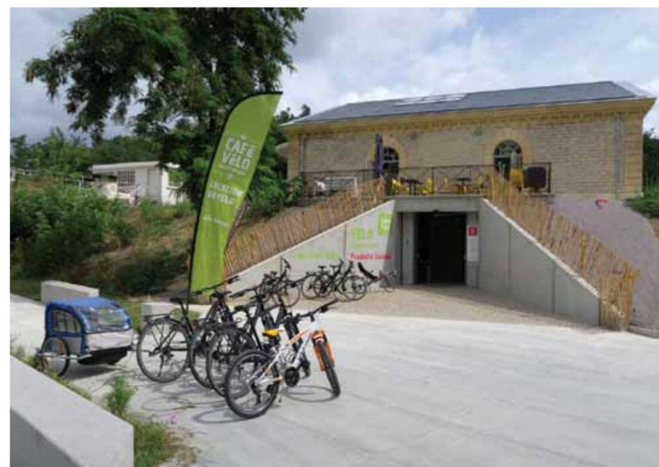
La façade ouest a été reconstruite en pierre, elle donne sur une terrasse qui reprend les dimensions au sol du poste de transformation démoli. Les murs de soutènement de talus créés pour la galerie couverte du niveau inférieur sont en béton. Par cette ouverture, le visiteur accède directement au service de location-réparation de vélos. Une piste cyclable passant sous le pont canal mène au bord de Garonne.