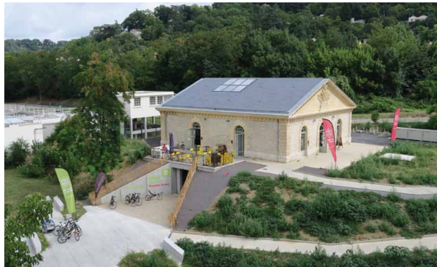
Vue du Café-Vélo, l'entrée vers l'espace restauration-hébergement s'effectue par l'esplanade haute, un accès à l'espace vélo est créé en contrebas en liaison avec les pistes cyclables. En arrière plan, le site industriel en activités, de traitement des eaux potables et des eaux usées de la ville.

1 - Terrasse (à l'emplacement du poste de transformation démoli) 2 - Sanitaire 3 - Dortoir 4 - Salle de restauration 5 - Espace vide donnant sur le sous-sol, protégé par une coursive métallique. 6 - Cuisine (la rotonde est le seul élément rajouté dans les années 1950 qui a été conservé)