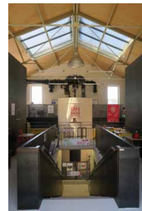
Vue depuis l'entrée haute, le choix des matériaux (métal) se réfère au passé industriel du lieu. Les éléments de charpente triangulaires, fermes de type Polonceau, n'ayant pu être conservés, ont été remplacés par de nouvelles fermes métalliques.