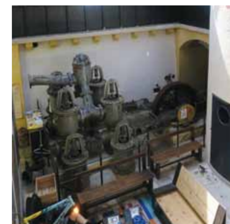
Au sol-sol, l'ancienne salle des turbines est aménagée en espace de détente et de rencontre.