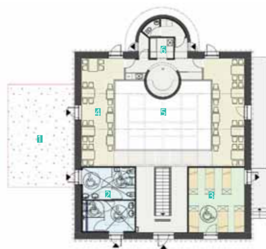
Plan du rez-de-chaussée (2016) © AMP Architecture

Éléments démolis lors de la réhabilitation A - Poste de transformation B - Passerelle C - Étage crée dans le volume du rez-de-chaussée