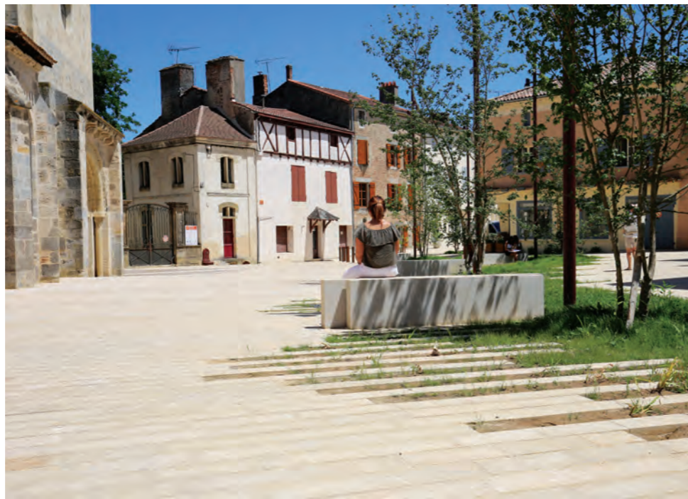
En redonnant une place prédominante aux piétons, en réintroduisant du végétal, ici des arbres en cèpée qui apportent fraîcheur et aménité, les espaces publics redeviennent des lieux de vie.