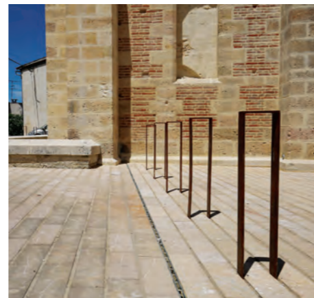
Les plantations au pied des immeubles valorisent le bâti et créent une ambiance végétale. Ces plantations situées entre la façade et l'espace public relèvent de la pratique du frontage. Grille d'évacuation des eaux pluviales, collecteur de gouttière, mobilier urbain (potelets et attache vélo) et emmarchement sont en acier corten.

Vous avez réalisé sur votre commune un projet architectural (extension, rénovation, construction d'un bâtiment) ou un aménagement d'espaces publics.