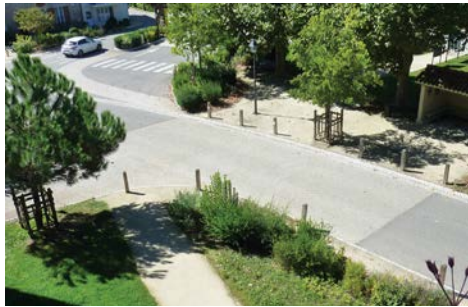
Plantations d'alignement le long de la RD