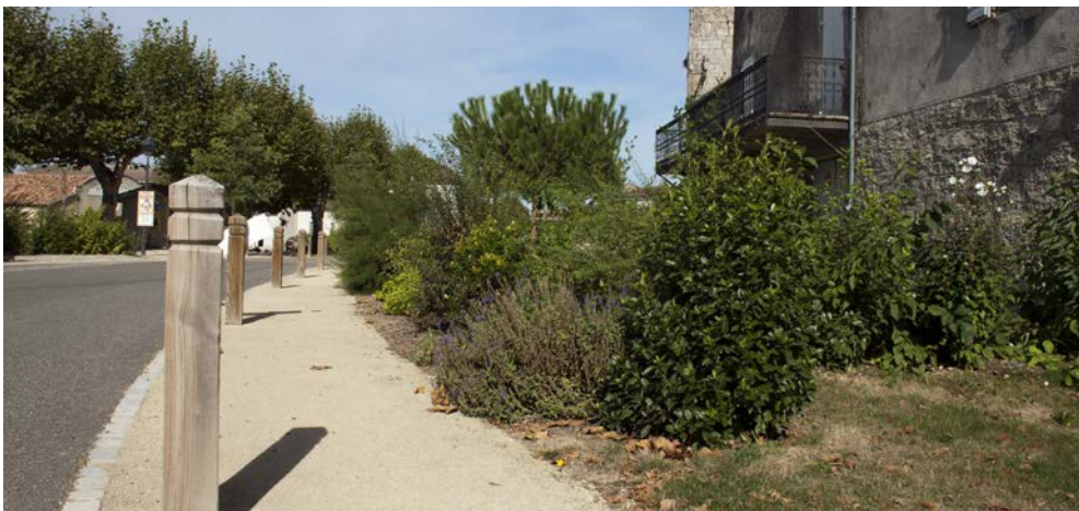
Jardins de pied de rempart, potelet bois

CE QUI A PLU AUX USAGERS → Les travaux de la traversée ont rythmé notre quotidien pendant des mois, avec parfois des « grincements », mais au final les habitants sont ravis et fiers de montrer leur village. Les bancs sont largement utilisés, les allées permettent de petites promenades sécurisées autour du bourg... La commune a installé une table de ping-pong sur l'espace herbagé devant la mairie et le « Sénat* » a retrouvé ses habituées ! (*abri bus devant la mairie appelé ainsi depuis sa construction - jusque dans les années 70 les délibérations du conseil y étaient apposées et les habitants y venaient pour refaire le monde !)