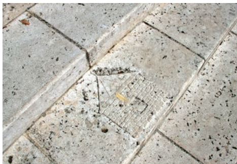
Détail d'embranchement en pierre