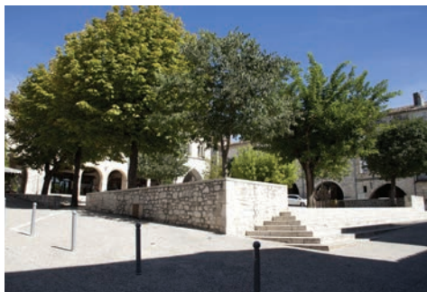
Plantation et mur de soutènement du carré central