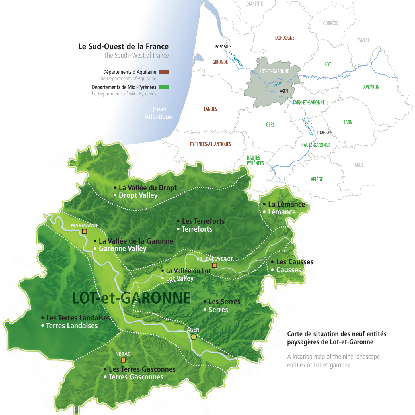
Carte de situation des neuf entités paysagères de Lot-et-Garonne

A location map of the nine landscape entities of Lot-et-garonne