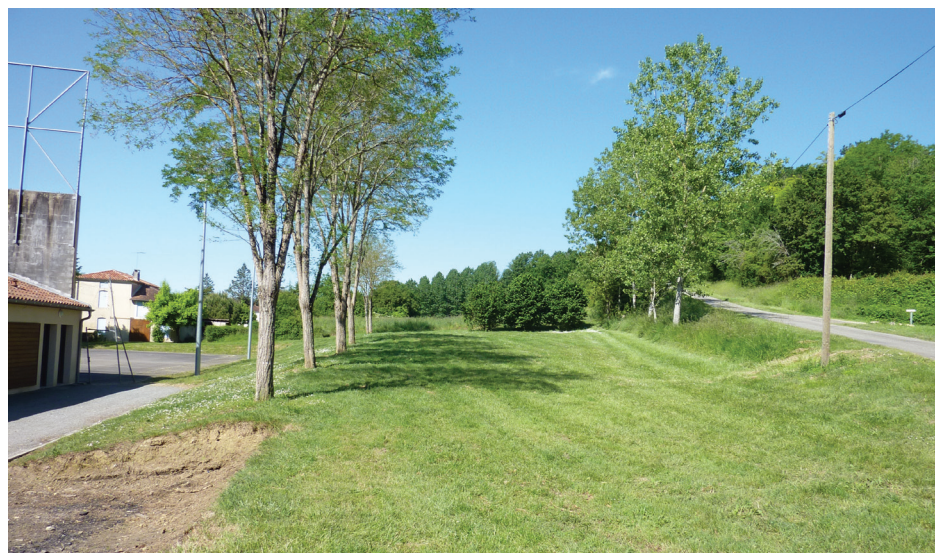
Terrain communal à aménager.