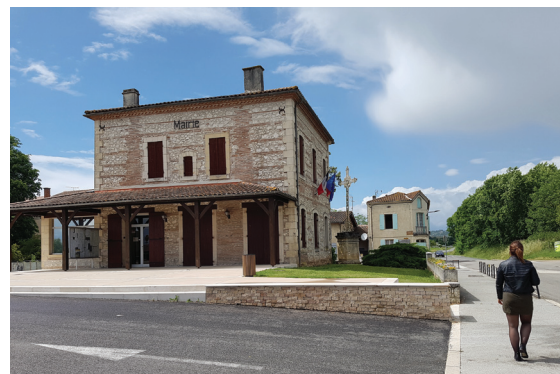
APRÈS TRAVAUX Le parvis la place de la mairie.