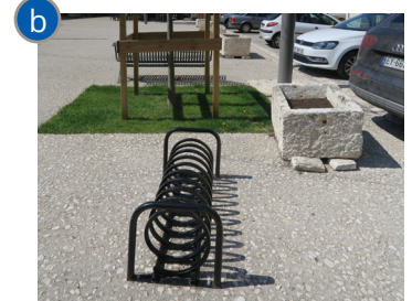
Mobilier sur la place de la mairie.