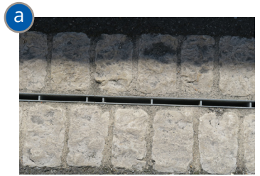
Caniveau à fente bordée de pavés calcaires dans la rue du Couvent.