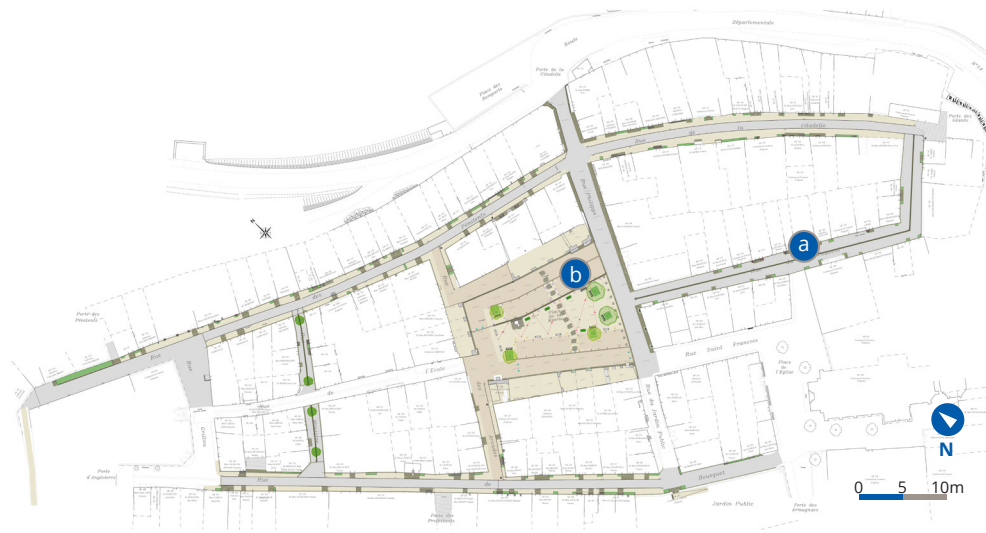
Plan masse de l'aménagement