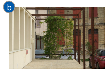
La rampe d'accès au bureau de Poste est complétée par une pergola supportant une glycine.