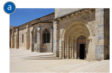
L'entrée de la collégiale est mise en valeur par un travail sur le nivellement.