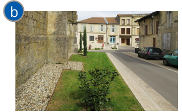
Abords de l'église : minéral et végétal