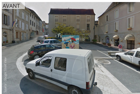
La place de la Liberté est débarrassée du stationnement pour mettre en valeur les façades ; une rampe PMR contourne la place et propose un cheminement plus convivial.