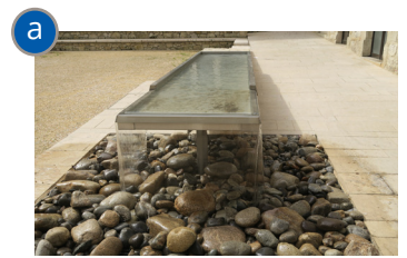
La fontaine (Place de la Liberté)