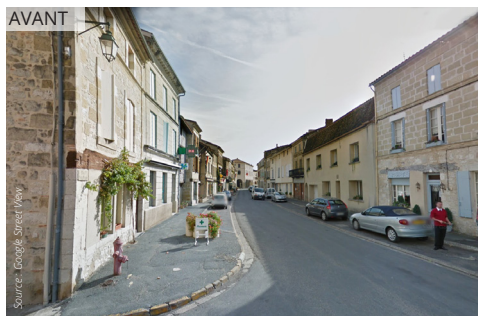
La chaussée de la rue Mazelier (désormais à sens unique) est mise à niveau et requalifiée avec des matériaux variés, des frontages végétalisés et un travail sur les seuils.

Les abords de l'église s'ouvrent sur l'espace public : la grille est enlevée, le tour de l'édifice est enherbé et planté, notamment au niveau du calvaire ; les accès sont clarifiés par le jeu des matériaux.