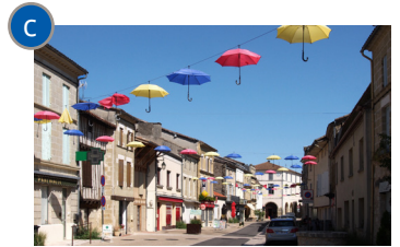
Animation estivale de la rue principale