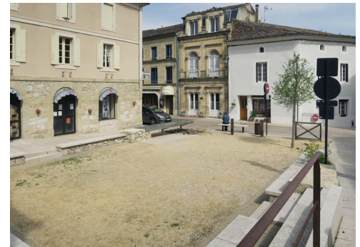
La Place de la Liberté, débarrassée du stationnement, redevient un lieu de rencontre, dont les limites sont mieux définies.