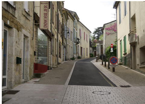
La rue du Château est dégagée du stationnement latéral et recalibrée grâce à l'usage de matériaux variés. Les pieds de façade sont soulignés par des dalles calcaires. La place est redonnée aux piétons dans la montée vers le château.