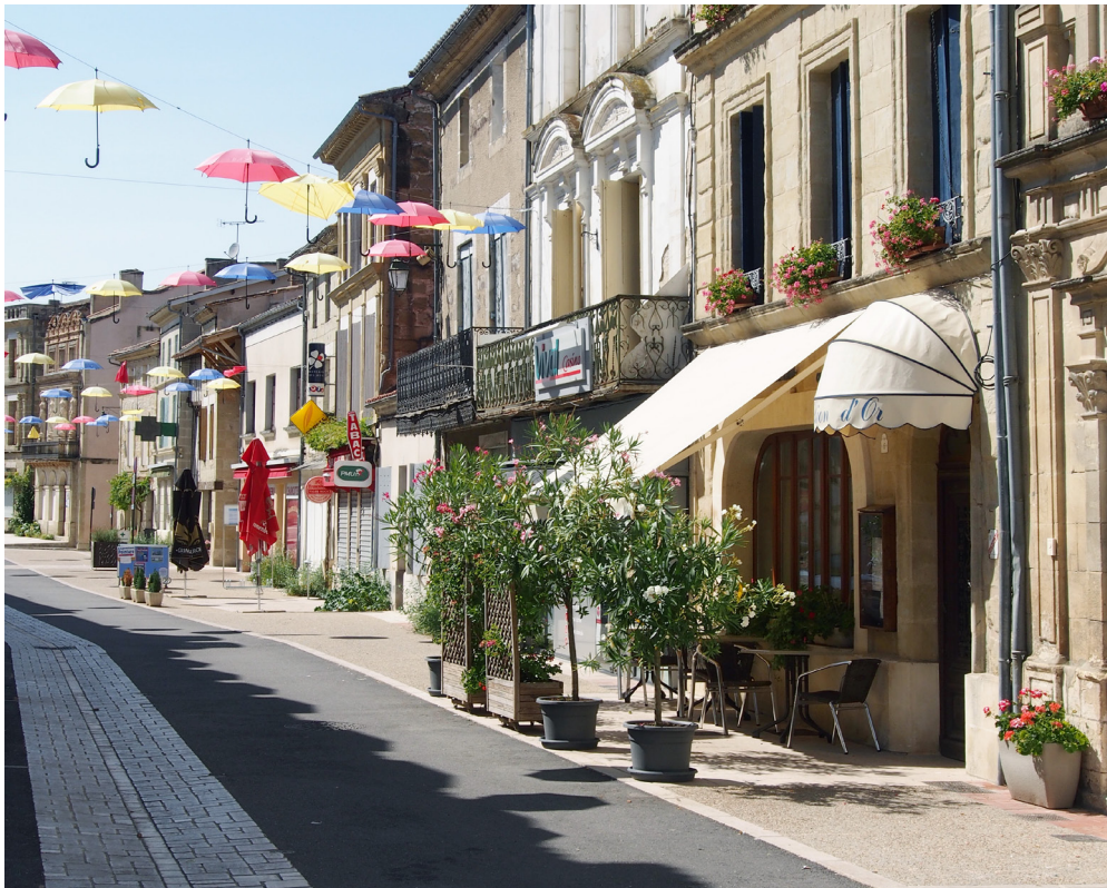
La rue Eugène Mazelier donne plus de place aux piétons qui profitent d'une ambiance apaisée.

L'une des intentions du projet est de réduire la place de la voiture sur la rue principale et sur la Place de la Liberté. Pour cela, la rue Mazelier est mise en sens unique, les places de stationnement sont conservées, les trottoirs et la chaussée sont mis à niveau. Les terrasses des restaurants et des commerces bénéficient de l'élargissement des trottoirs.