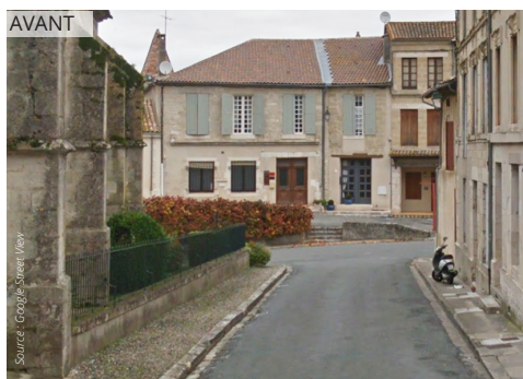
La rue Tournante est mise à niveau ; la grille qui entoure l'église est supprimée ce qui crée un espace plus ouvert qui valorise l'édifice.