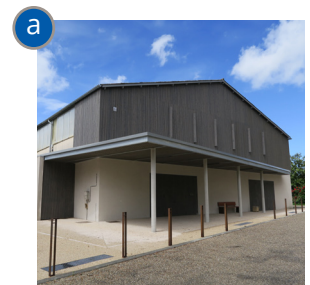
Gymnase - salle des fêtes : façade restaurée