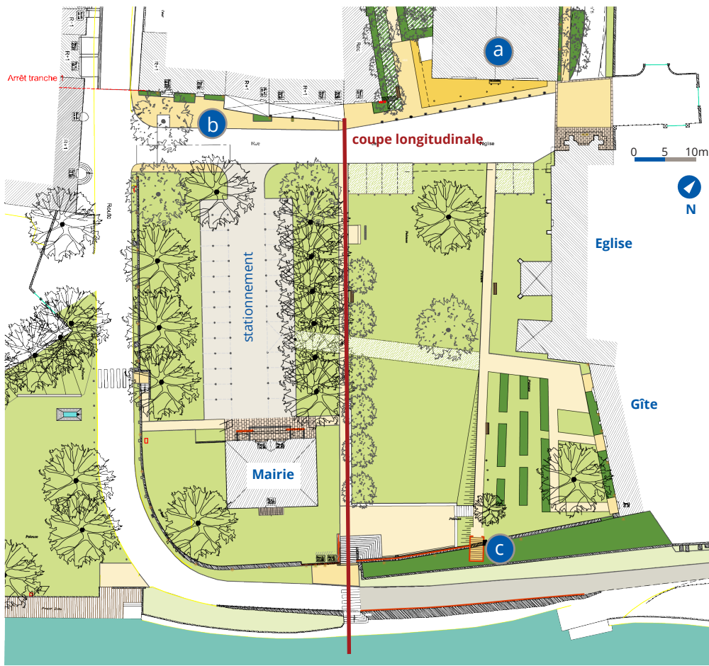
Plan masse de l'aménagement