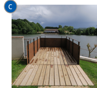
Une vue panoramique sur le Lot