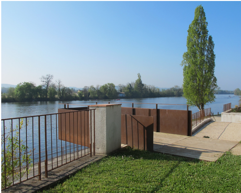
Le belvédère en acier corten et platelage bois crée une avancée surplombant le Lot.

L'aménagement du centre-bourg de Fongrave consiste à retisser un lien fort entre le Lot et le centre de gravité du bourg constitué par la mairie, le gymnase-salle des fêtes, l'église et l'ancien presbytère.