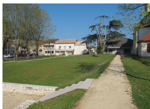
Une vaste pelouse relie et unifie l'espace entre les bâtiments du centre-bourg.