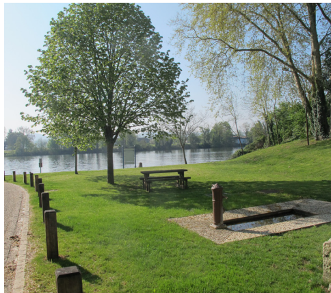
Un endroit calme et intime appelant au repos, à proximité de la rivière.