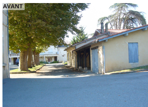
La démolition de l'école dégage un espace permettant de mettre en valeur l'église.

Des frontages végétalisés sont ajoutés ou élargis en pied de façade le long de la route départementale avec des plantes rustiques et locales, ce qui rend la rue plus agréable à parcourir et valorise les façades.