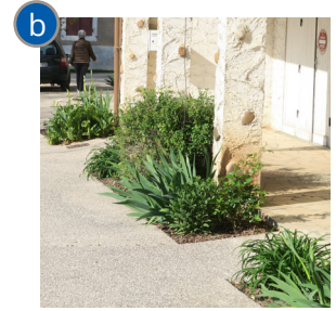
Frontages végétalisés élargis : sauges arbustives, iris, hemerocalles...