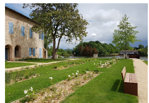
Un espace jardiné met en valeur l'ancien presbytère.