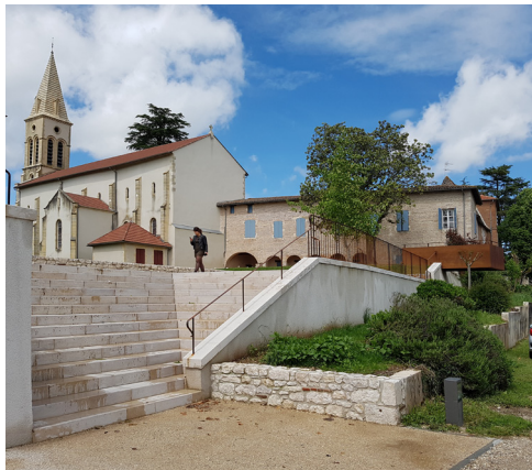
Un escalier en pierre calcaire pour mettre en avant la descente vers le Lot.