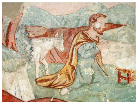
Fresque de l'église de Saint-Pè Saint-Simon © Commune de Saint-Pè Saint-Simon