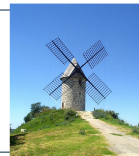
Moulin de Coulx

Dans le département, un club de mécènes, intitulé "Mécènes du patrimoine en Lot-et-Garonne", est en place depuis septembre 2019 et décide, collectivement, de participer à des restaurations exemplaires.