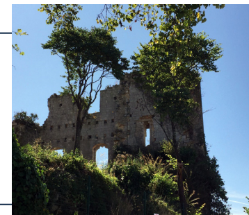
Château de Montgaillard

L'organisation d'une collecte de dons est l'outil premier de la Fondation du patrimoine : en effet elle permet non seulement de drainer des fonds de tout un chacun mais aussi de susciter un élan populaire en faveur du projet objet de l'opération mise en place. Particuliers, artisans, commerçants, entreprises, peuvent donner au profit du projet de leur choix tout en bénéficiant d'avantages fiscaux.