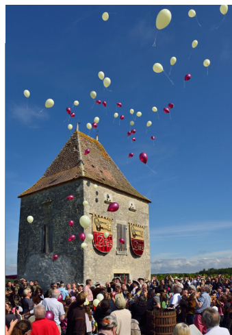
Pigeonnier de Saint-Astier