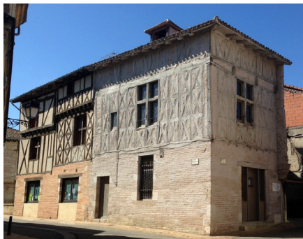
Maison des Consuls à Caudecoste