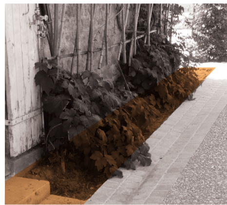
Espaces consacrés au frontage

La collectivité publique doit donc s'en occuper. Elle peut néanmoins autoriser les riverains à le faire. Et même prendre les devants en délimitant des frontages par des tracés sur le sol et sur les plans. En définissant des règles peu contraignantes, la collectivité encouragera ainsi les bonnes volontés.